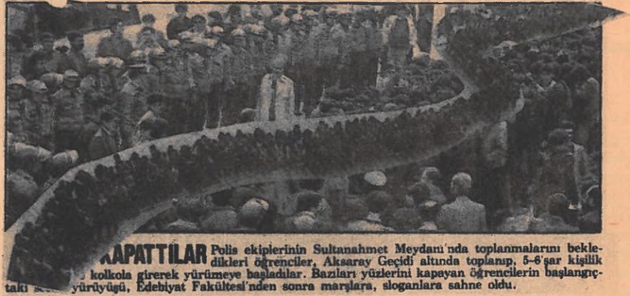
KAPATTILAR Polis ekiplerinin Sultanahmet Meydanı'nda toplanmalarını bekledikleri öğrenciler, Aksaray Geçidi altında toplanıp, 5-6'şar kişilik kolkola girerek yürümeye başladılar. Bazıları yüzlerini kapayan öğrencilerin başlangıçtaki yürüyüşü, Edebiyat Fakültesi'nden sonra marşlara, sloganlara sahne oldu.