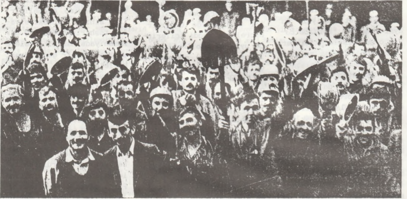
Bugün okul masrafları için, yarın siyasi iktidar için...

işçilerini her gün ölümlerle burun buruna getirmekten çekinmediği gibi, grevleri "milil güvenlik" nedeniyle yasaklıyor ve işçilerin normal yaşamlarını sürdürmeleri için istedikleri zammı ve sosyal hakları vermiyor ve "sakıncalı" buluyor. Maden işçilerinin birmilyon istemesinin sakıncalı olan yanı olmadığı gibi, bugünkü şartlarda asgari bir geçim düzeyi bile değildir. Her gün zam üstüne zamin geldiği, alım gücünün gündelik olarak sürekli düştüğü bir düzende, işçilerin yaşamlarını en asgari düzeyde sürdürmeleri için istedikleri ücreti bile vermemek, alçaklıktır. Faşist Türk hükümeti, dünya jandarması eli kanlı ABD emperyalist haydutlarınının bir dediğini iki etmez iken, 'kendi milletim' dediği Türkiyeli işçilere ve emekçilere verdiği değer ortadadır. Onlar için önemli olan sınıf kardeşliğidir. Efendilerine vatani ve