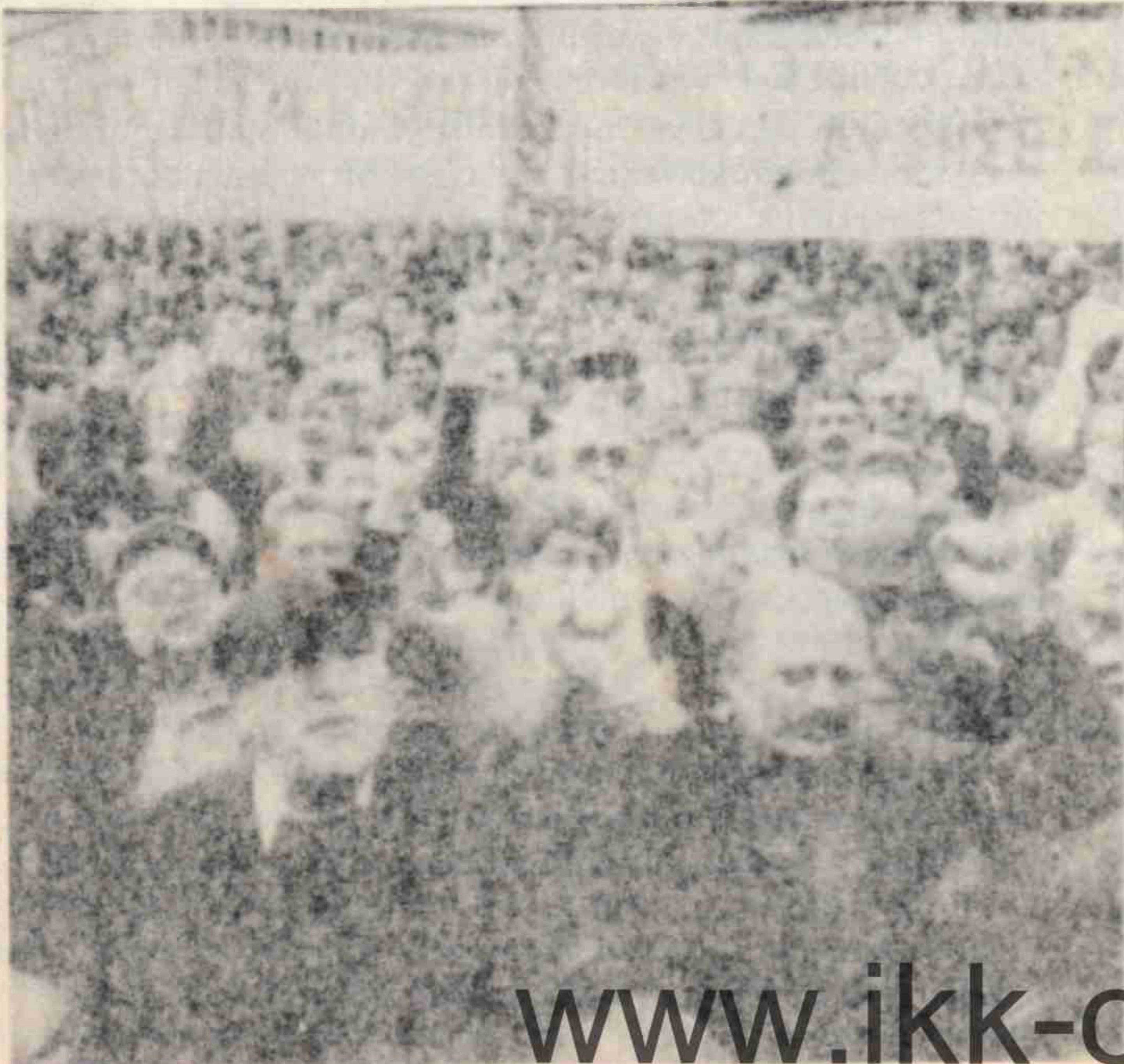
Halk Papandreu Hükümetine karşı gösterilerini artırıyor!

Türk ve Yunan egemen güçlerinin uzun zamandır körükledikleri gerginlik, Mart ayının son haftasında uç noktaya tırmandırılarak Ege'de bir savaşın eşiğine gelindi. Yunanistan Hükümetinin Ege Denizinde petrol arama çalışmalarını yeniden başlatmasına misilleme olarak Türk Hükümetinin de MTA-Sismik-1'i Ege Denizindeki Türkiye kara suları dışındaki bölgelerde petrol aramaya gönderme kararı iki ülke arasındaki ezeli düşmanlık zemini üzerinde körüklenen gerginliği bir anda yüksek boyutlara tırmandırdı. Her iki ülke hakim sınıflarının denetimindeki basın ve yayın organları aracılığıyla koyu bir şövenizm körüklenirken, her iki ülkenin sınır bölgelerinde askeri yığınak yapıldı. Türk ve Yunan deniz kuvvetlerine bağlı savaş gemileri Ege'de toplanırken, hava kuvvetlerine bağlı askeri uçaklarda moral uçuşlarını yoğunlaştırdılar.