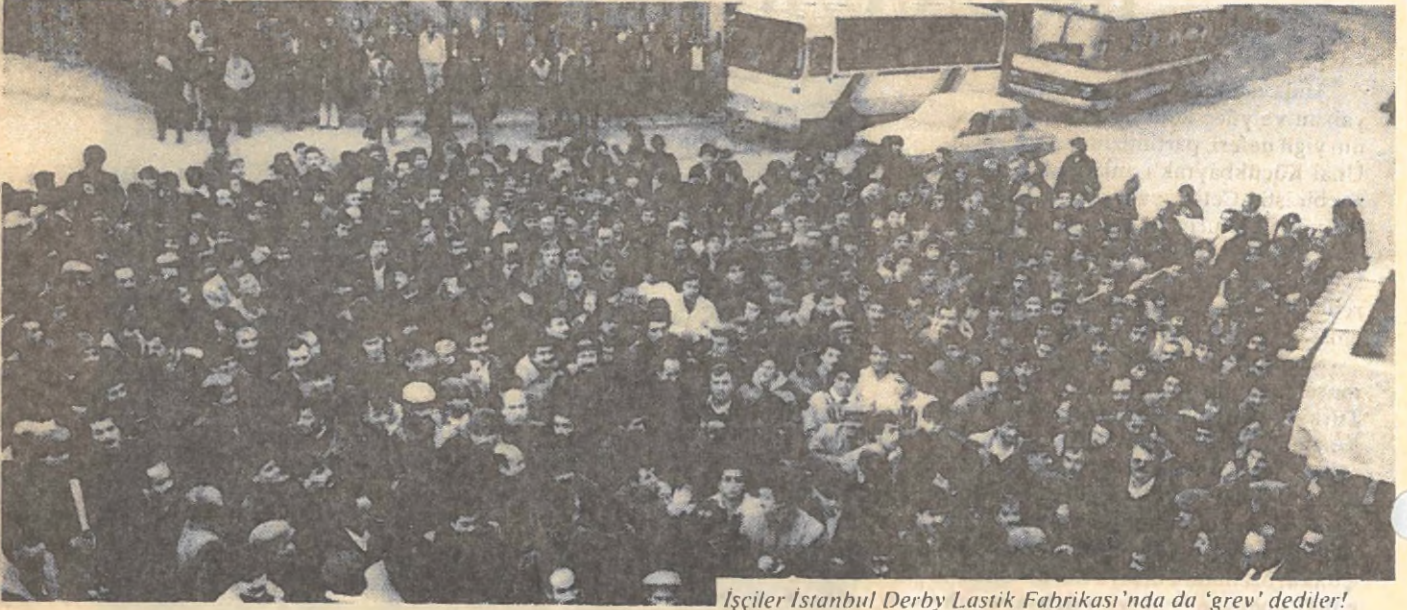
İşçiler İstanbul Derby Lastik Fabrikası'nda da 'grev' dediler!