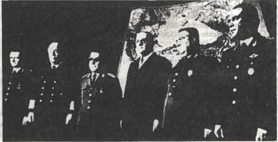
Muhsin Batur, Hava Kuvvetlerinden emekli Orgeneral, 12 Mart boyunca yürütülen işkence ve baskıların suç ortağı. DENİZ, YUSUF, İNAN'ın idamından sorumlu Nato 'cu faşisttir. Emekliye ayrıldıktan sonra, CHP'den senatör seçildi ve 12 Eylül öncesi Cumhurbaşkanlığına aday gösterildi. Eren cuntasıyla başta iyi ilişkiler içinde olan Batur, idam ve işkencelere acaba neden karşı çıkıyor ?... Yukarıdaki fotoğrafta 12 Mart muhtırası verildikten sonra Kuvvet Komutanları Cumhurbaşkanıyla birlikte.

demokratik talepleriyle kendini sınırla-maz, kendi çıkarlarıyla çaktığı nok-talarda onu destekler ve bulunduğu noktadan daha ileriye doğru sevkeder. Kendisinin demokrasi programını bir an bile karartılmasına ya da kitlelerin aldatılmasına müsaade edemez.