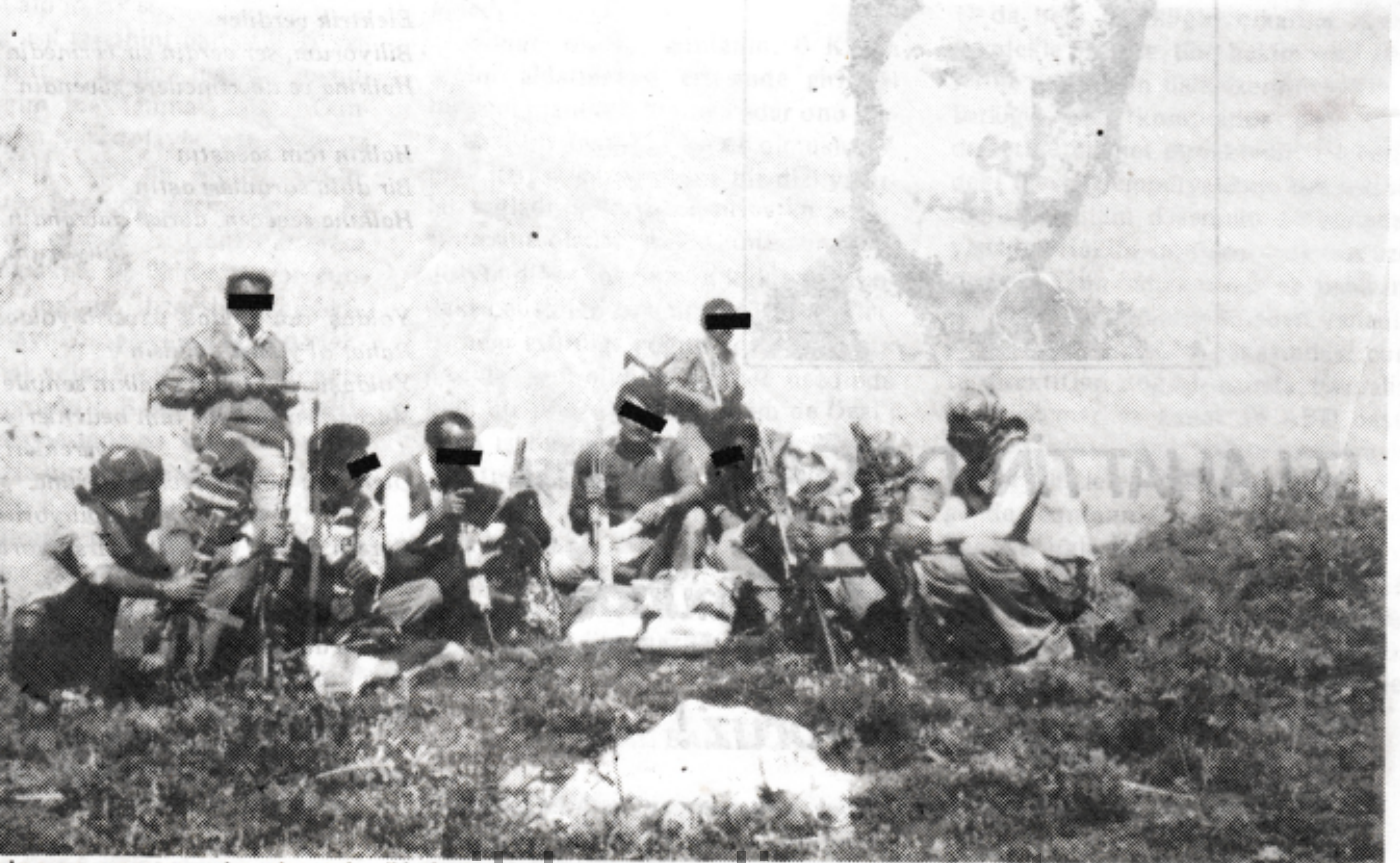
TIKKO GERİLLALARININ BİR SİYASİ EĞİTİM ÇALIŞMASI

Bölge Komitemizin kampanya ile ilgili bildirisinin yayınlanmasıyla Parti Devamı Syf: 33'de