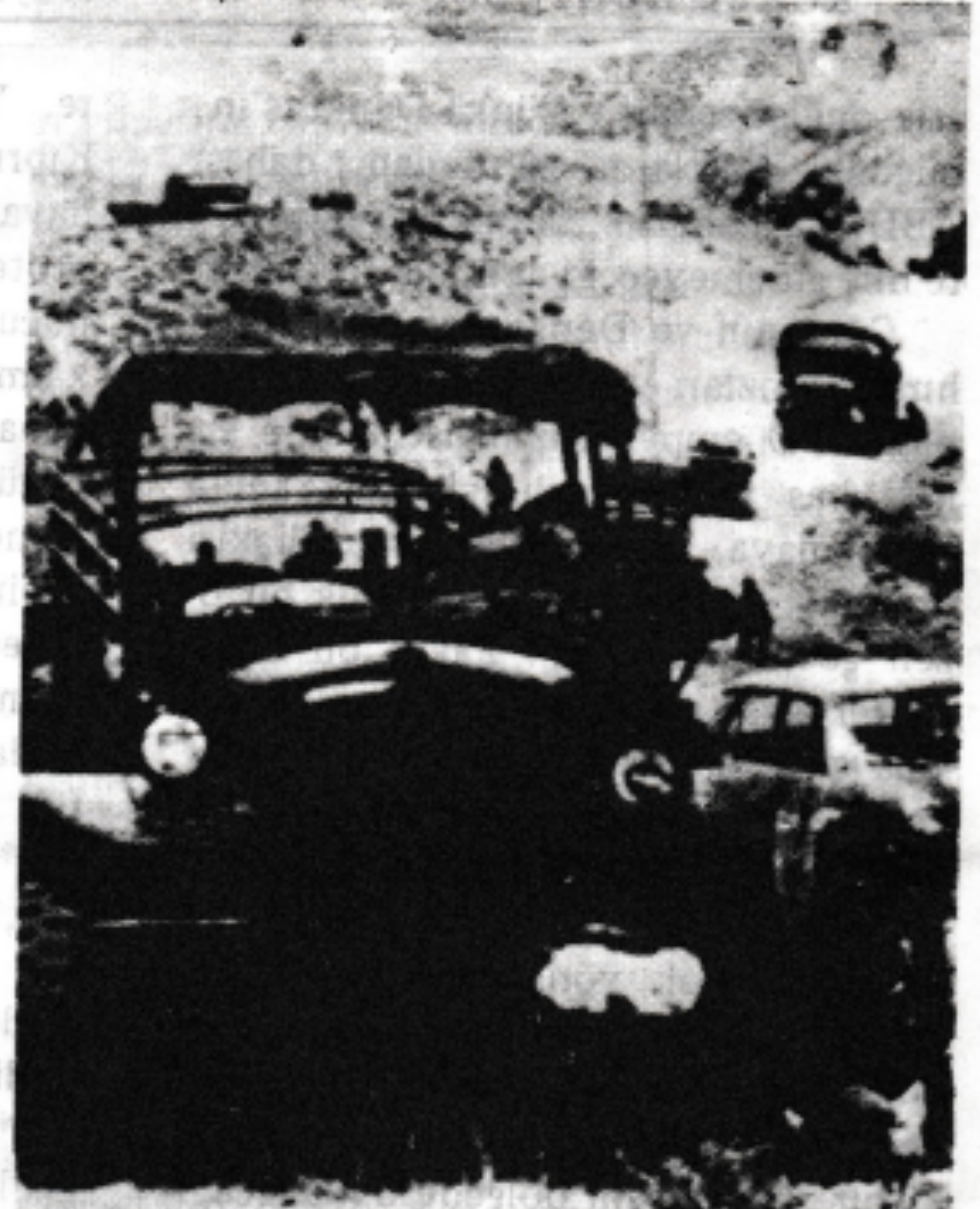
Faşist Türk ordusunun Kıbrıs işgali